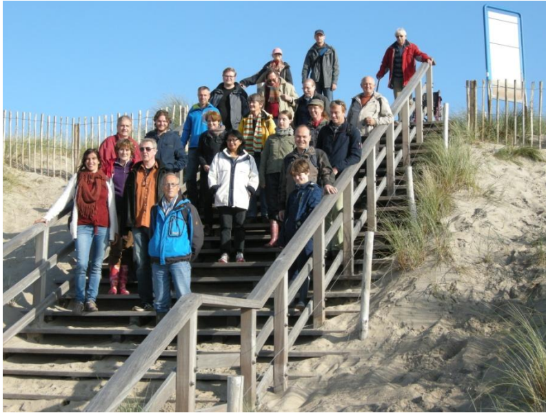
Afb. 4: Groepsfoto van de deelnemers aan de excursie op de trap naar het strand van Maasvlakte 2.