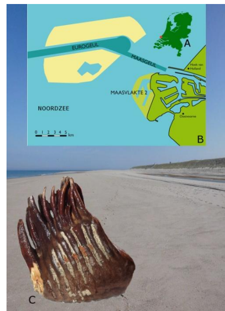
Afb. 1: Op de achtergrond het strand van Maasvlakte 2, een paleontologische goudmijn! A) Locatie van MV2 (rode stip) (illustratie: Jerry Streutker). B) Overzichtskaart van het Eurogeulgebied met daarin het zandwingsgebied waar ook het zand voor MV2 gewonnen is (geel) en MV2 zelf (geelgroen) (illustratie: Jaap van Leeuwen). C) Bovenkaakmolaar van een wolharige mammoet in anatomische positie (kauwvlak naar onderen), van het opgespoten strand.

een kunstmatig op diepte gehouden geul die grote zeeschepen toegang tot de haven van Rotterdam geeft. Doordat in deze geul en het omliggende zandwingsgebied veel zand is weggezogen door sleepopperzuigers, vormt nu een fossielrijke laat-pleistocene laag de zeebodem. De zandwinning voor MV2 is gedaan in het Eurogeulgebied. Er is voor een bijzondere aanpak gekozen: waar normaal gesproken slechts 4 tot 6 meter zand wordt weggezogen, is voor deze enorme suppletie een gat van maar liefst 20 meter diepte gezogen. En dat maakt MV2 heel bijzonder: we vinden juist door die diepe zandwinning ook veel vroeg-pleistocene fossielen uit oudere lagen. Een 7,5 km lang strand vormt onderdeel van de buitencontour van Maasvlakte 2. Dat is vrij toegankelijk en daar worden dus dagelijks fraaie fossielen gevonden.